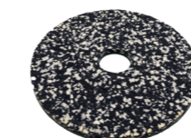
Power Pad (cousinnet). N° d'art. 201076