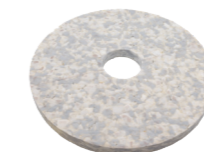
Pad en duo. N° d'art. 201077