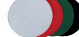
Tampons à disques pour chaque surface, de différentes duretés.