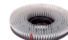
Brosse à shampooing. N° d'art. 205120